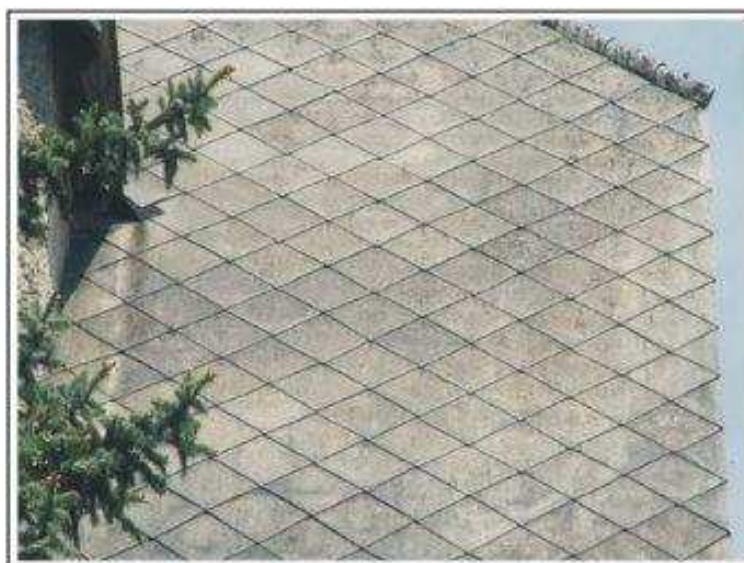
Fot.4 Pokrycie dachowe budynku mieszkalnego z płytek typu "caro" - III stopień pilności