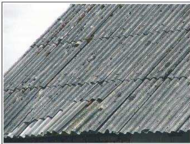
Fot.1 Pokrycie dachowe budynku gospodarczego z płyt falistych - I stopień pilności

ZAŁĄCZNIK 2: Dokumentacja fotograficzna (przykłady pokryć dachowych o różnym stopniu uszkodzeń poszycia).