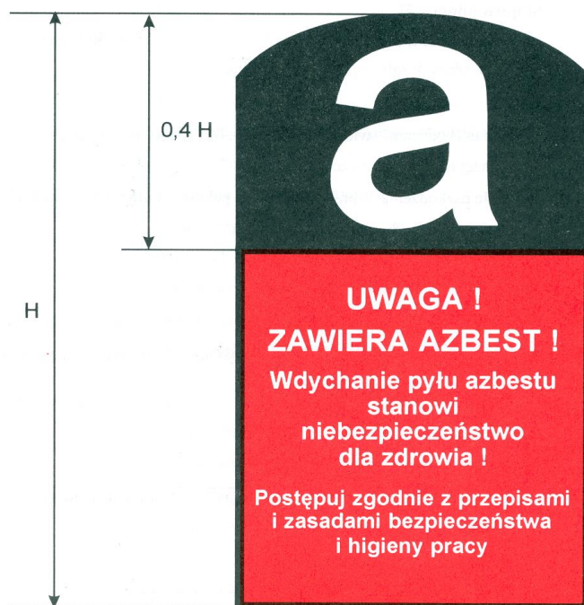
Rys.2. Wzór etykiety do oznakowania wyrobów i odpadów zawierających azbest, zgodnie z załącznikiem do Rozporządzenia Ministra Gospodarki, Pracy i Polityki Społecznej z dnia 2 kwietnia 2004 r. w sprawie sposobów i warunków bezpiecznego użytkowania i usuwania wyrobów zawierających azbest.