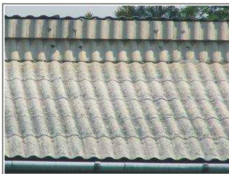
Fot.3 Pokrycie dachowe budynku mieszkalnego z płyt falistych - III stopień pilności