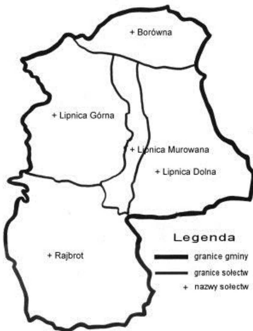
Rys 1. Mapa gminy Lipnica Murowana