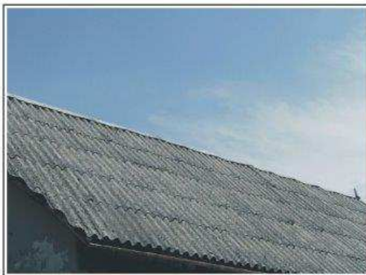
Fot.2 Pokrycie dachowe budynku mieszkalnego z płytek falistych - II stopień pilności